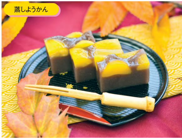
(盛り付けイメージ)