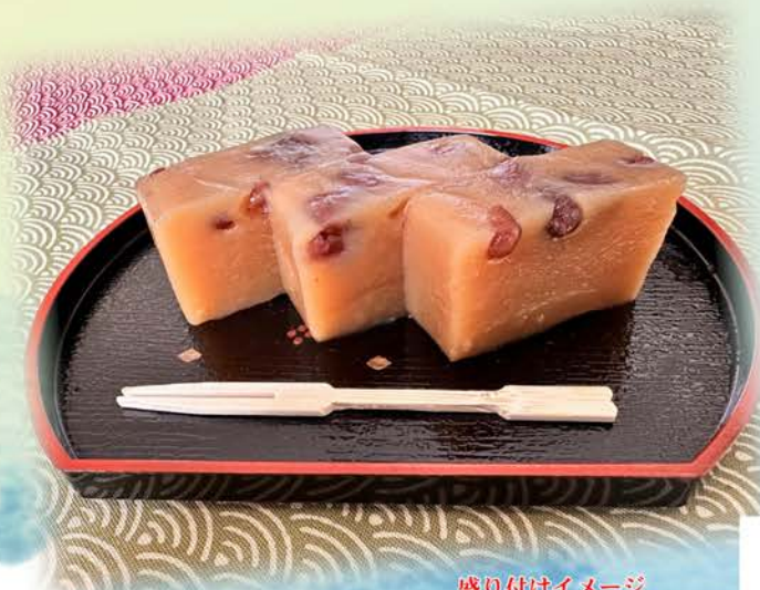
盛り付けイメージ